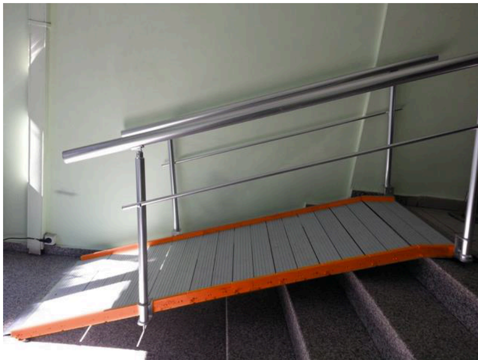
Rambardes et pieds disponibles en option (sur devis)