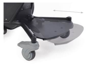
Plateforme repose-pieds extensible