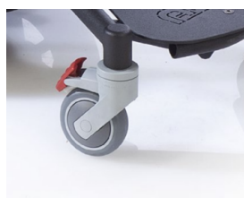
Roues avant pivotantes