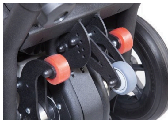
Dispositif de réglage de l'inclinaison : Le support arrière s'adapte à la hauteur de marche pour assurer la stabilité : pas besoin de chercher le point d'équilibre