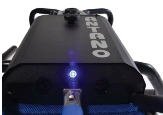
Eclairage de courtoisie à LED augmente la visibilité de la marche