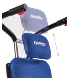
Appui-tête réglable jusqu'à 16 cm