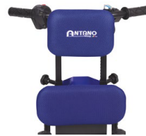
Hauteur dossier réglable