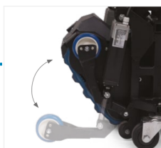
Kit roue avant