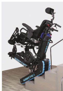
Rampes hautes pour fauteuils électriques et manuels : repose-pieds haut adapté aux petits espaces de manoeuvres

45 avenue Georges Politzer - Z.A de Trappes-Élancourt 78190 TRAPPES