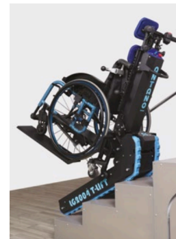
Rampes courtes pour fauteuil roulant à cadre léger