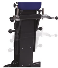
Fixation fauteuil réglable