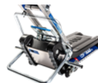
Barre de bascule