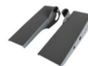
Rampes fauteuil de transfert