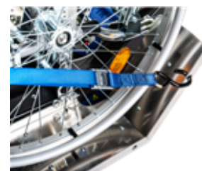
Sangle de fixation