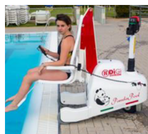
Sans assistance (avec la télécommande filaire étanche) :

Il suffit de se placer avec PandaPool au bord du bassin et d'actionner le bouton montée/descente du bras extensible. Sûr, le PandaPool dispose de 8 niveaux de sécurité pratique pour l'utilisateur. PandaPool est très facile à manipuler grâce à sa motorisation et ses dimensions. Confortable pour la personne transportée. PandaPool est équipé de roues en caoutchouc, différentes options de ceintures, appui-tête et repose-pieds et télécommande (en option).